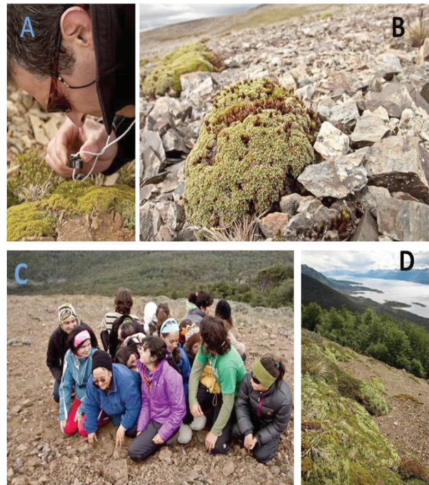
Figura 2. Ecoturismo con lupa en las jardineras subantárticas altoandinas. A) Investigación interdisciplinaria de la diversidad florística en las plantas en cojín del altoandino en el cerro Bandera, Isla Navarino. B) Comunidad vegetal asociada a cojines de Bolax gummifera , metafóricamente denominada “jardinera subantártica altoandina”. C) Actividad de campo ecológica y éticamente guiada “co-habitando como plantas altoandinas”. D) Conservación in situ de comunidades vegetales asociadas a plantas en cojín en el circuito interpretativo del Parque Omora – Sendero de Chile, Cerro Bandera.

Paso 2. Comunicación y composición de metáforas: jardineras subantárticas altoandinas. Para reparar la incongruencia entre los dominios biofísico y simbólico-lingüístico, se trabajó en la generación de una imagen mental alternativa a “desierto andino”. Las plantas en cojín, como B. gummifera , constituyen una de las formas de vida más características de los ambientes de alta montaña y pueden generar microhábitats que favorecen el establecimiento de otras plantas dentro del cojín, más que sobre el suelo adyacente. Esto sugiere que las especies en cojín actuarían como facilitadoras (Méndez et al. 2013). Metafóricamente, las plantas en cojín actúan como “jardineras”, formando islas de “jardines subantárticos” que proporcionan un sustrato orgánico más estable y abrigado que permite el crecimiento de musgos y plantas con flores. Basado en esta comprensión botánica y ecológica, el trabajo poético cambia nuestra representación mental desde un “desierto andino” hacia el concepto metafórico de “jardineras subantárticas altoandinas”.