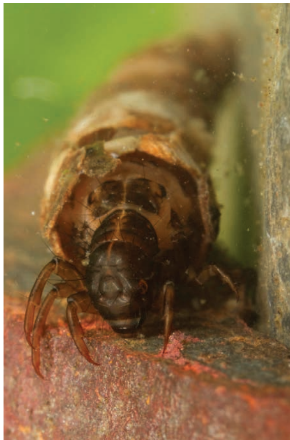
Figura 3. Larva de tricóptero ( Monocosmoecus sp.) que habita bajo el agua en el río Róbalo dentro de su cocón o “madriguera” (Gr. ethos , origen etimológico de la palabra ética), fabricada con sus glándulas productoras de seda a la que adhieren detritus vegetales, arena y piedras pequeñas.

El díptero Gigantodax rufescens (Simuliidae) presentó un ciclo de vida muy sensible a cambios de temperatura. En respuesta al gradiente térmico altitudinal del río Róbalo (586 m - 0 m), su ciclo de vida varía de multivoltino a univoltino, i.e. , desde varias a solo una generación por año